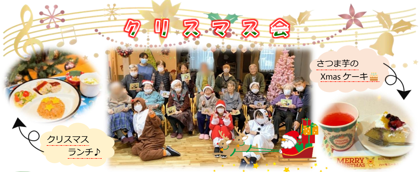
クリスマス ランチ♪