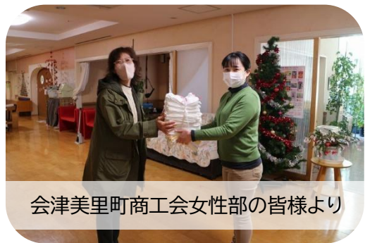
会津美里町商工会女性部の皆様より