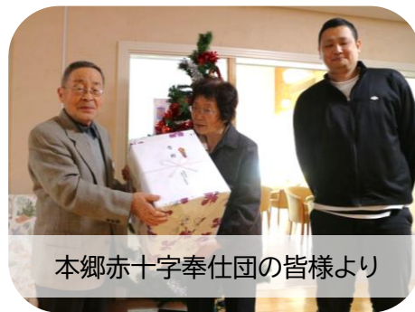
本郷赤十字奉仕団の皆様より