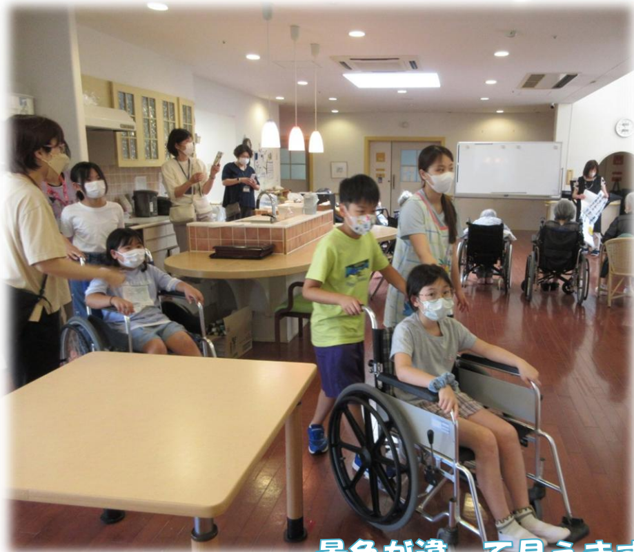
景色が違って見えます ♪