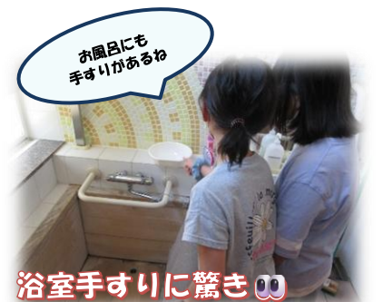
お風呂にも 手すりがあるね