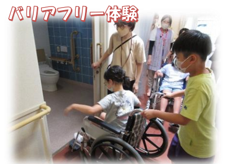
バリアフリー体験