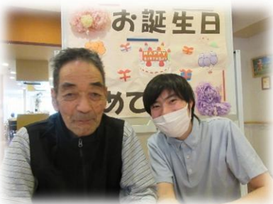
今月はお一人お誕生日でした。 おめでとうございます！