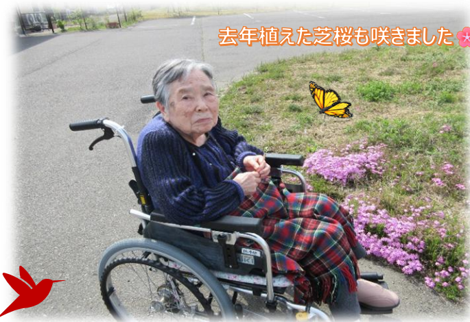
去年植えた芝桜も咲きました🌸