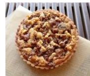
いちじく&くるみの タルト (直径約15cm)