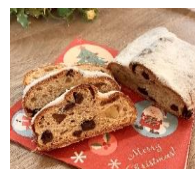
Copain シュトレン (約17cm×10cm)