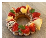
生いちごタルト (直径約15cm)