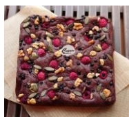
ベリーベリー ショコラ ブラウニー (約18cm×18cm)