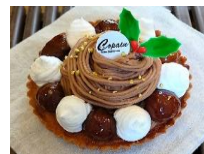
モンブランタルト (直径約15cm)