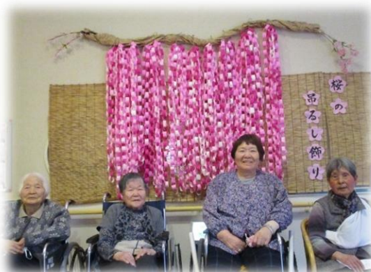
みんなでハイチーズ！！

春といえば桜！デイサービスでは春の訪れを感じていただくとうと桜の制作を行いました。