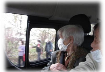
わいわいと賑やかな雰囲気♪