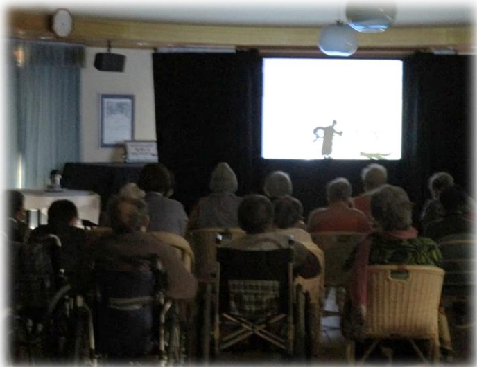
劇団赤とんぼのみなさん♪

12月24日のクリスマスイブに特別企画として、影絵劇団『赤とんぼ』をお招きしての影絵鑑賞会を行いました。