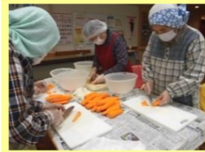
↑お客様と一緒に豚汁の材料切り◎