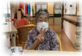
Vサイン Part 4