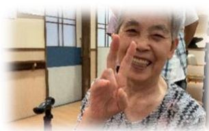
Vサイン Part 1