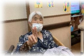
Vサイン Part 3