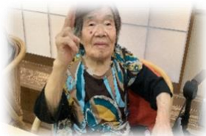
Vサイン Part 2