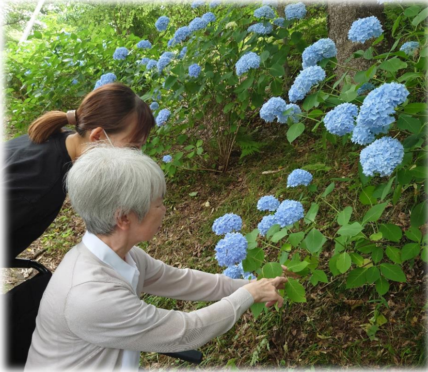
青と緑の美しさにうっとり♡