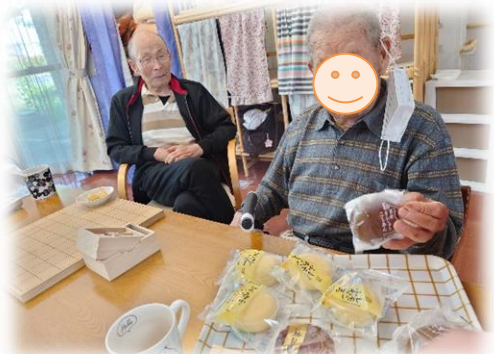
おやつを選ぶのも楽しいです♪

お花が好きなお客様が多いCチーム。『紫陽花を見に行こう!』と題し、梅雨の晴れ間が広がった6月21日、お隣三春町の城山公園に出掛けてきました。