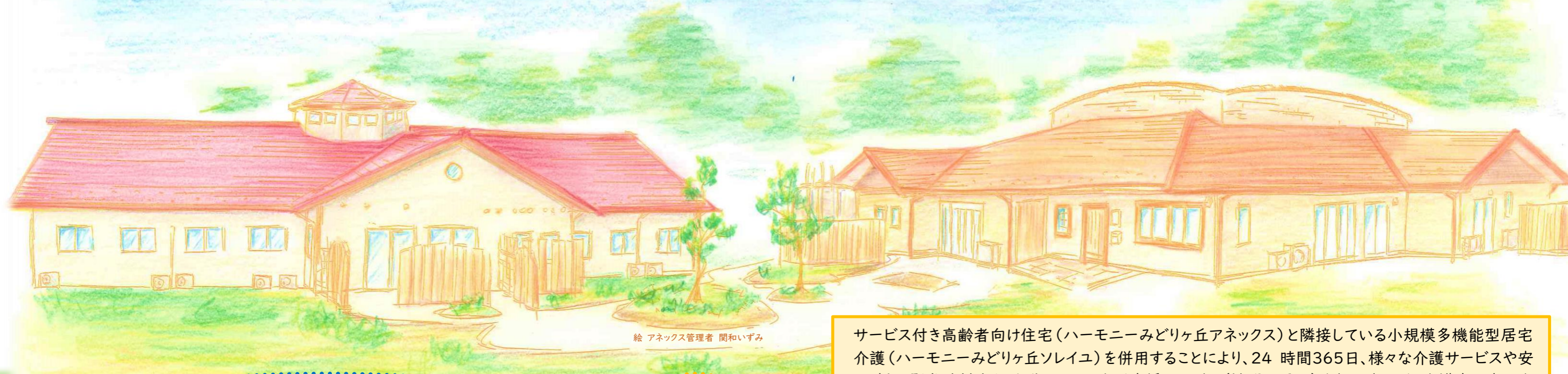
絵 アネックス管理者 関和いずみ